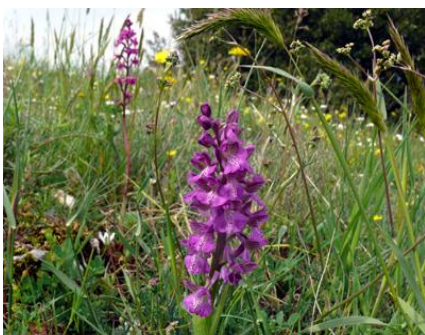
Orchis morio x papilionacea