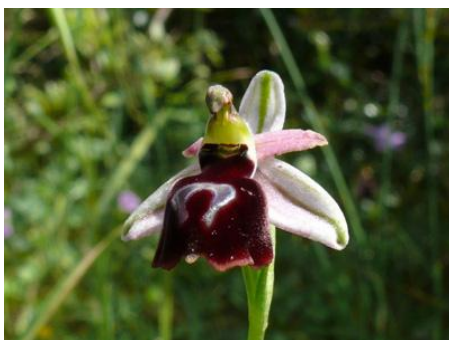
Ophrys ferrum - equinum