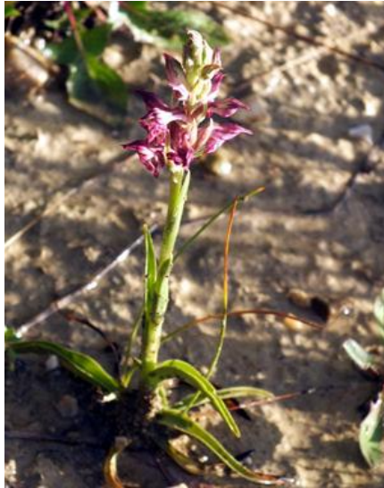
Orchis coriophora ssp. fragrans