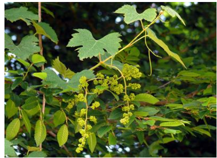
Vitis vinifera ssp. sylvestris