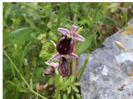
Ophrys ferrum - equinum