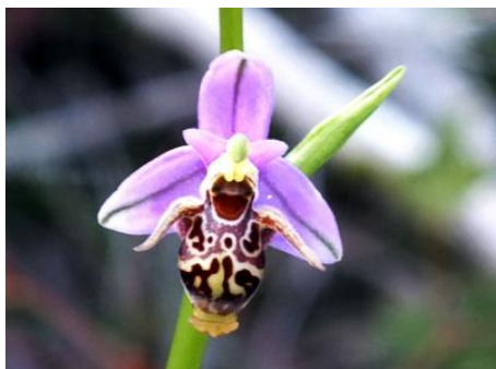
Ophrys scolopax , možná přikřížený