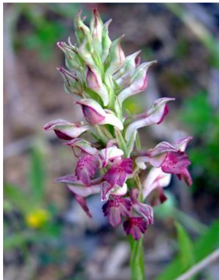
Orchis coriophora ssp. fragrans