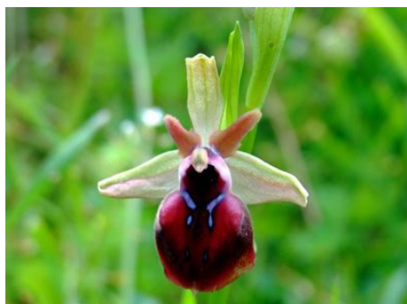
Ophrys helenae x mammosa