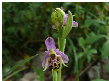
Ophrys scolopax ssp. cornuta