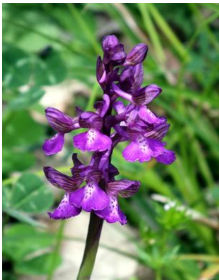
Orchis morio x papilionacea