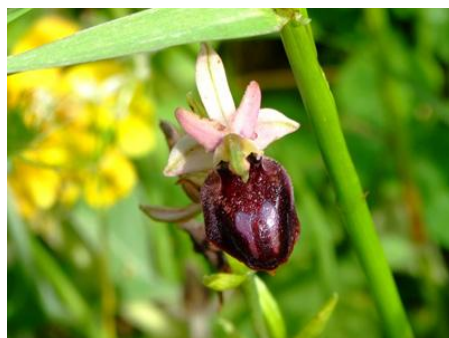
Ophrys ferrum - equinum