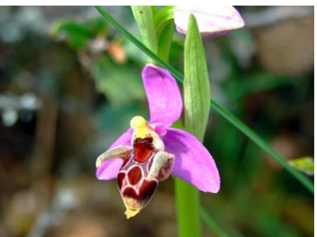
Ophrys scolopax. ssp. cornuta