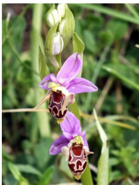
Ophrys scolopax. ssp. cornuta